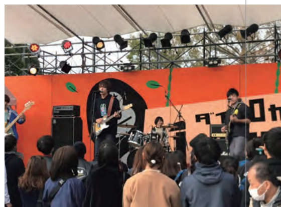
大学の学祭でのライブの様子