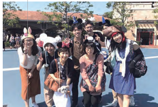
ゼミ仲間、先生とディズニールンドへ

地元の公立高校に入学した当初の私は、「大学進学率」という言葉も知らないほど、勉強にも進学にも興味が薄かったように思います。しかし、たまたま学ぶことの面白さを教えてくれる先生方と出会い、一気に「勉強が楽しい」と思えるようになりました。部活動も好きでしたが、「二日で一番楽しいのは授業の時間」というくらい、わくわく授業を受け、放課後も先生を質問攻めにしていただくことを覚えています。 中でも、お気に入りの現代文の授業。素材となっていた人文・社会科学の思想を通して、思考の幅を一気に広げられるように感じました。担当の先生が京大の教育学部出身だったことから、「こうした考え方ができる人になりたい」と思ったのが、京大に興味を持ったきっかけです。しかし、入試難易度からなかなか決断できず、心を決めたのはセンター試験を終えてから。先生方や友達に助けってもらいながら慌てて二次試験の勉強をし、周囲に助けられて進学できたので、幸運だったと思っています。