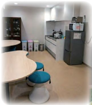
キッチンスペース（隣接）

また、小学生を持つ教員からは「小学校の学級閉鎖時や、学童保育園終了後の研究打ち合わせの際に、チャイルドケアスペースを使わせていただきました。親が机のスペースで仕事をして、子どもが畳部屋で宿題することができました。畳部屋に子ども用の折りたたみ机があれば、もっと便利だと思います。」との声がありました。