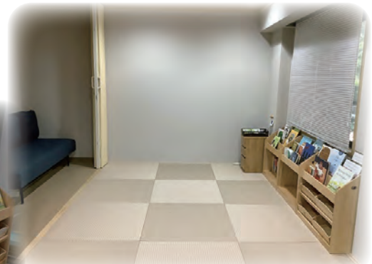
多目的休憩スペース（畳部屋）