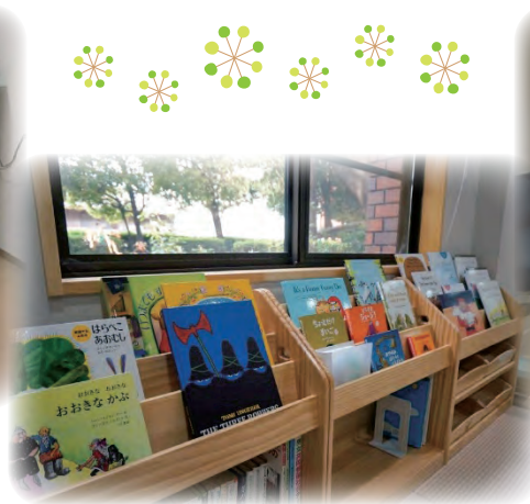
バイリンガル絵本